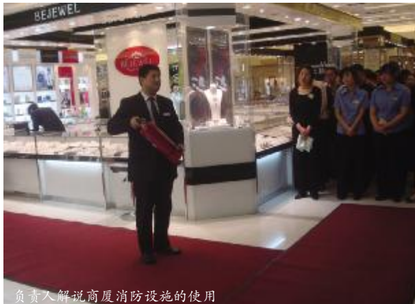
负责人解说商厦消防设施的使用

18日早上8:30,模拟演习开始。首先由员工在4层发现火情,立即按下就近的手动报警器,并通知楼层主管。消防中心人员用监控器对火情现场确认,启动消防自动系统(防火卷帘自动下落),并立即通知商厦义务消防队对初级火灾进行扑救(用消火栓和灭火器进行扑救),同时通知店长汇报情况及请示进行人员疏散,得到疏散命令后,启动商厦消防应急疏散预案(通知紧急联络小组)。商场各层人员立即有序地进行撤离。8:35商厦内所有人员全部撤离,演习结束。