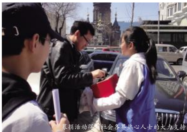
募捐活动得到社会各界热心人士的大力支持

同学们一天的忙碌与劳累中浸透着成功的喜悦。据统计,这次募捐活动他们共筹集善款2688.3元,于5月4日汇给中国红十字基金会。(来源/黑龙江文化产业网 文图/松雷中学初二(2)班 指导老师/沈永姝)