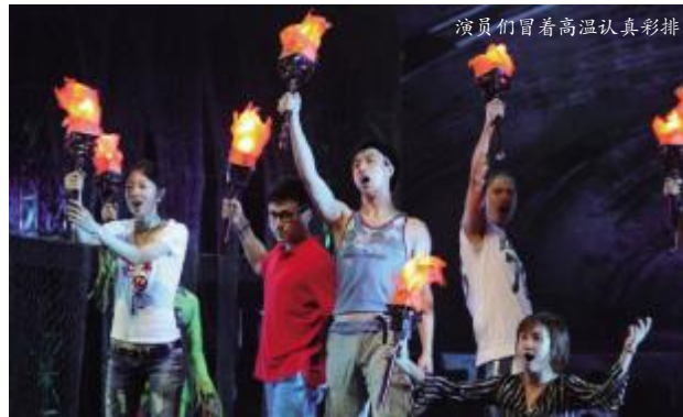
演员们冒着高温认真彩排

广州天气潮湿闷热,演员们冒着高温走场,这些才华横溢的年轻人在舞台上,挥洒着汗水与青春,是为了一番事业,一条信念?还是为了自己所热爱的音乐剧,心中的梦想?世界尽头仿佛隐藏着说不完的故事,每一个蝶人的喜怒哀乐,一个个鲜活性格,这是一场没有配角的戏。音响、灯光、特效、