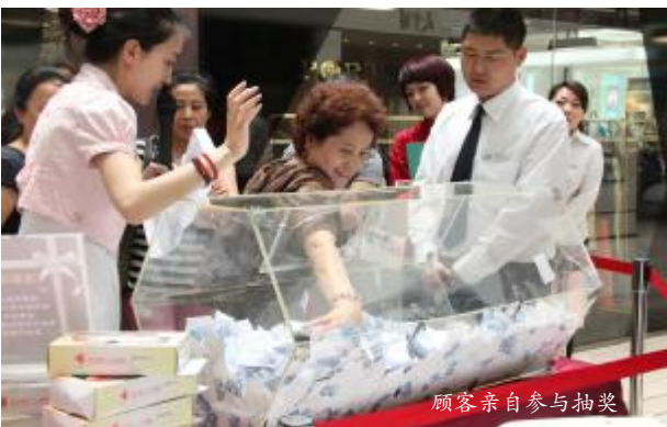
顾客亲自参与抽奖

称其为“购物狂欢”并不为过。每年总有两个晚上,松雷商业会盛情邀请VIP贵宾参与其中。活动开始前,店门的每一次开合,陈列台的鲜花环簇,店员的真诚微笑,都只为了表达我们那一份真挚的回馈之情,只为了衬托贵宾那一份与众不同的尊贵。