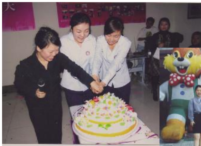
↑ 2007年道里大型改造后的第一个店庆生日 与店里员工一起庆祝家园15岁生日

时间多么快,一晃,11年就过去了。我在道里松雷工作、成长、恋爱、结婚、生子……回首往事,历历在目!一起经历了1999年的开业,2001年的辉煌店庆,2003年的非典恐慌,2007年的闭店调整,2008年的……在这里,我感受着成功的喜悦,失败的教训,生命的可贵,家人的温暖,林林总总的往事,真叫人思绪万千啊!感谢的人那么多,感动的事那么多!今生注定有缘,我愿与道里店共同续写新的篇章。